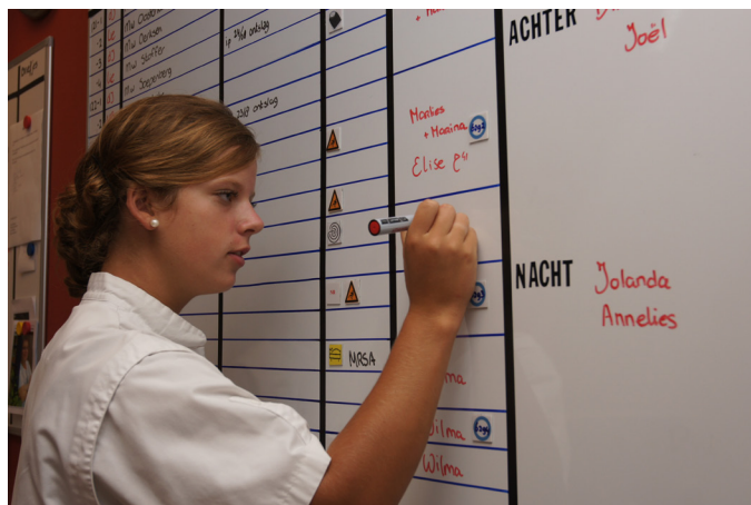
Een verpleegkundige werkt het patiëntinformatiebord bij